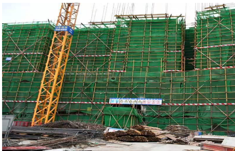
图一 事故发生建筑

事故发生地位于深圳市深汕特别合作区深圳市深汕特别合作区赤石镇的观山云邸楼盘 2 期 3 号楼（见图一），坐标 N22° 54′ 23″，E115° 0′ 15″（见图二）。