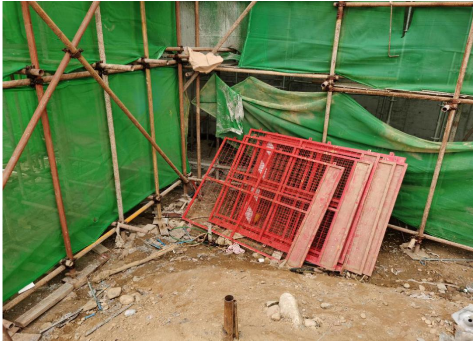
图七 秦义国高处坠落的地面处