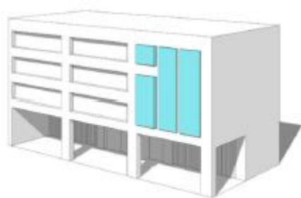
广告成组集中布置示意（纵向布置）

2.3.3 同一地段、同一建筑的户外广告设施应成组设置，其类型、规格、造型及画面设计等应与建筑物及周边环境保持整体协调。