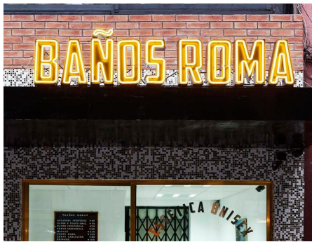
裸光源照明 (霓虹灯)