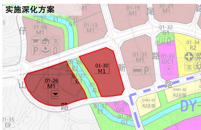
地块控制指标一览表 (实施深化前)