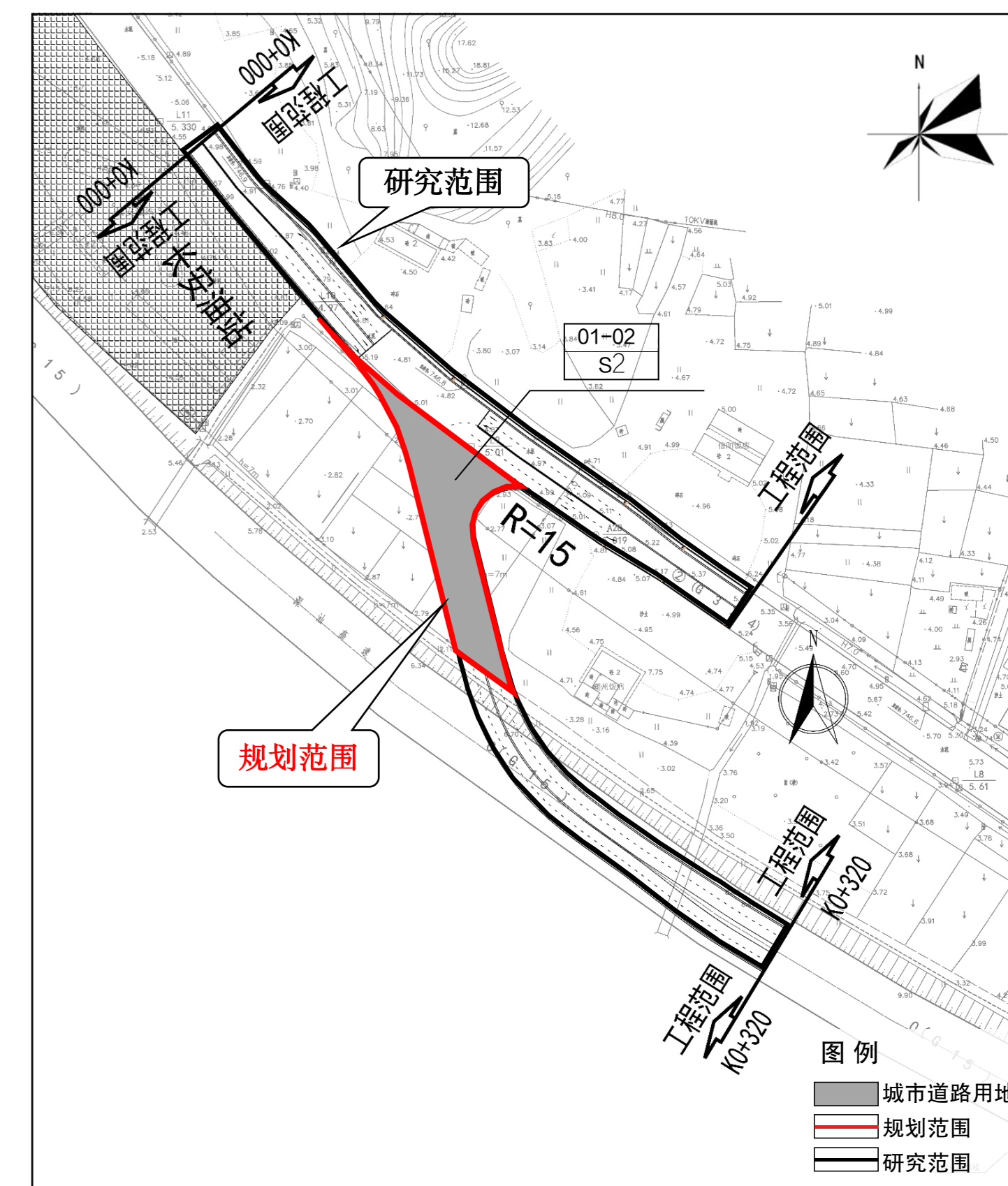
项目选址地块土地利用规划图